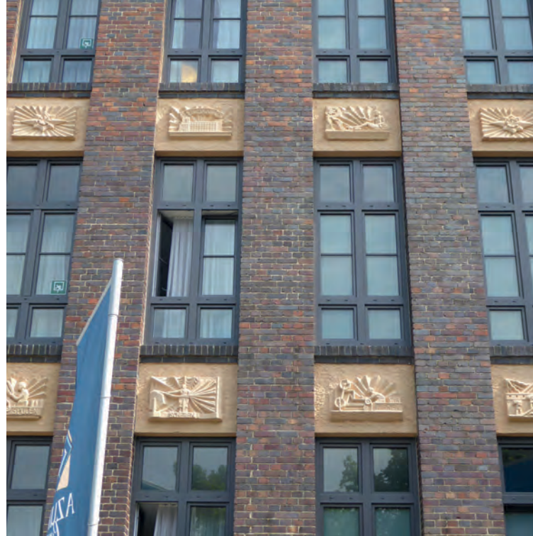
Verwaltungsgebäude mit Reliefs zur Textilproduktion, 2015

Benannt ist der Fabrikkomplex nach der Tochter des englischen Textilunternehmers und Firmengründers Leo Shaers.