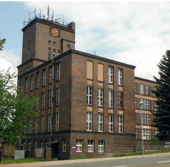
Fabrikkomplex vor der Sanierung, 2014

Ein imposantes Fabrikgebäude prägt die Landschaft von Chemnitz nach Hartmannsdorf fahrend an der Gabelung in Richtung Burgstädt: die ehemalige Wirk- und Webfabrik „Recenia“. Nachdem der Gebäudekomplex in der DDR-Zeit dem VEB Feinwäsche „Bruno Freitag“ zur Produktion und anschließend als Handelseinrichtung für Antikwaren, Gardinen und Teppiche diente, stand er die letzten Jahre leer. Der ehemalige Eigentümer stellte die Anlage zum Verkauf. Diese erhielt mit dem Erwerb durch die AZURIT Gruppe die Chance auf eine neue, dauerhafte Nutzung und den Erhalt des denkmalgeschützten Gebäudebestandes.