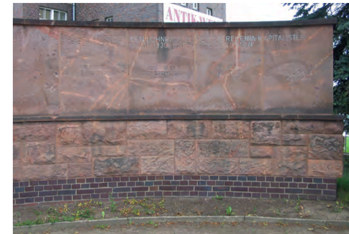
Mahnmal für die beim Streik getöteten Arbeiter, 2009

Am 15. Januar 1930 wurden im Anschluss an eine Massenkundgebung der Fabrikarbeiter fünf Streikende von Beamten der Sicherheitspolizei erschossen und mehrere schwerverletzt. Heute erinnert ein Mahnmahl unweit des ehemaligen Fabrikgeländes an die Ereignisse.