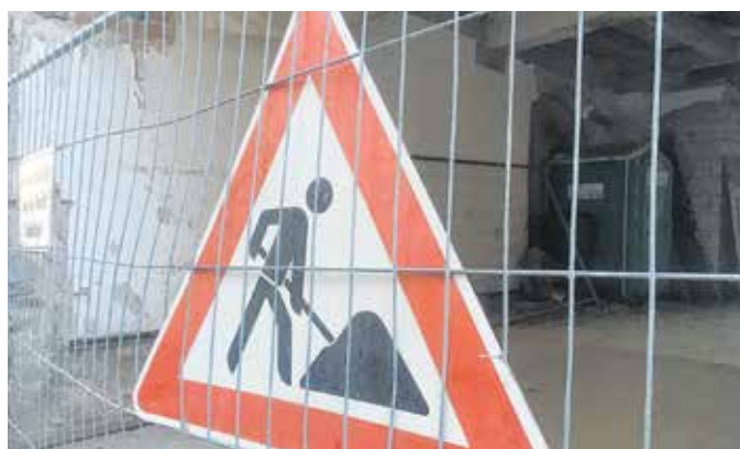
Wenn sich der Eigentümer nicht kümmert, muss der Landkreis eingreifen, sollte Gefahr von maroden Gebäuden ausgehen.

Noch einen Abriss gab es in Waldheim. Um ein Haus an der Breitscheidstraße kümmerte sich die Bauaufsicht seit 2016. Der Abriss begann im Mai und wird