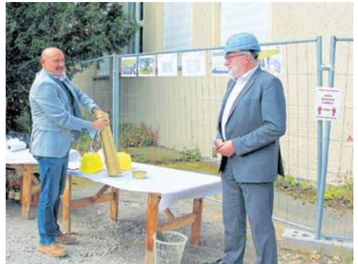
Skizze: Iproplan Planungsgesellschaft mbH

In den Sommerferien 2020 investiert der Landkreis Mittelsachsen in Bau- und Werterhaltungsmaßnahmen seiner Schulen rund 1,77 Millionen Euro. Die unterrichtsfreie Zeit wird genutzt, um zu renovieren, zu sanieren und Neubauprojekte voranzubringen.