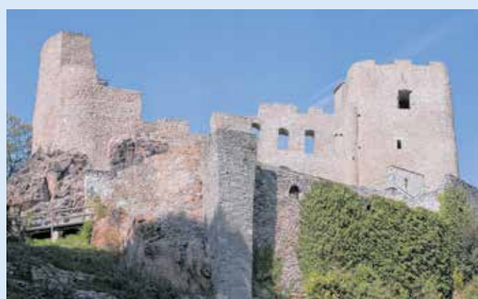
Die feierliche Eröffnungsveranstaltung des Landkreises findet auf der Burgruine Frauenstein am 13. September um 10:00 Uhr statt.