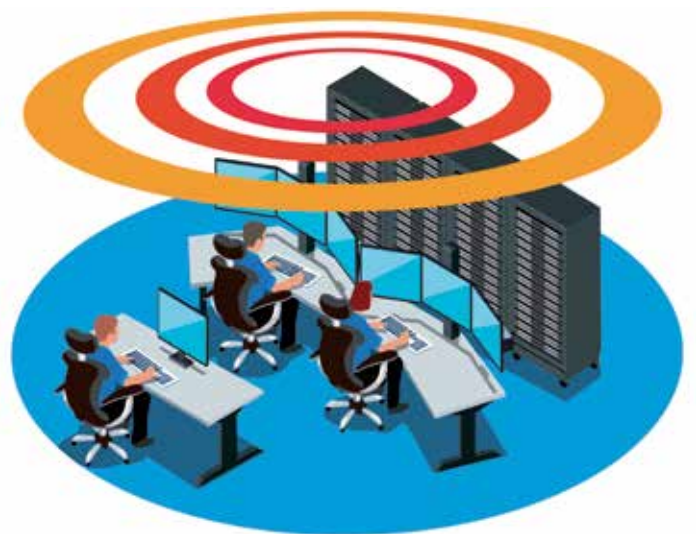
Grafik: ISF Bund-Länder-Projekt „Warnung der Bevölkerung“

Seit Juli ist die neue Website www.bundesweiter-warntag.de online verfügbar. Die Seite erklärt, in welchen Fällen und auf welchen Wegen die