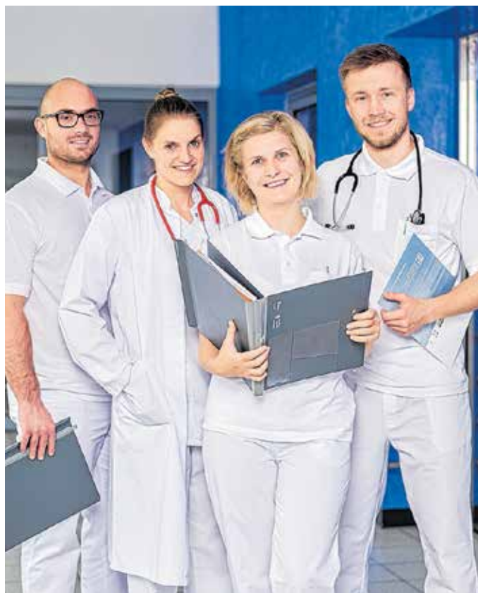
Die Kliniken in Mittelsachsen suchen in verschiedenen Fachbereichen schon heute Ärzte und werben für den Nachwuchs, wie die Landkreis Mittweida Krankenhaus GmbH auf ihrer Internetseite mit diesem Bild.

Mit dem Programm „Rundum gesund – Ärztin/Arzt werden für Mittelsachsen“ sollen langfristig Ärzte für den Landkreis gewonnen werden. „Wir wollen junge Menschen, die sich auf den langen Weg eines Medizinstudiums machen, von Anfang an unterstützen und für Mittelsachsen als Lebensmittelpunkt und Arbeitsort gewinnen“, sagt Landrat Matthias Damm. Dafür werden ab dem Wintersemester 2020/21 jährlich bis zu drei Studenten der Humanmedizin mit einem Stipendium unterstützt. Ziel ist es, dass diese sich später in Mittelsachsen als Arzt niederlassen. Das Stipendium wird für maximal sechs Jahre gewährt und beträgt 400 Euro monatlich. Hierfür verpflichten sie sich, alle Praxisphasen ihres Studiums und ihre Facharztausbildung soweit möglich an medizinischen Einrichtungen im Landkreis zu absolvieren. Zum Programm gehören außerdem